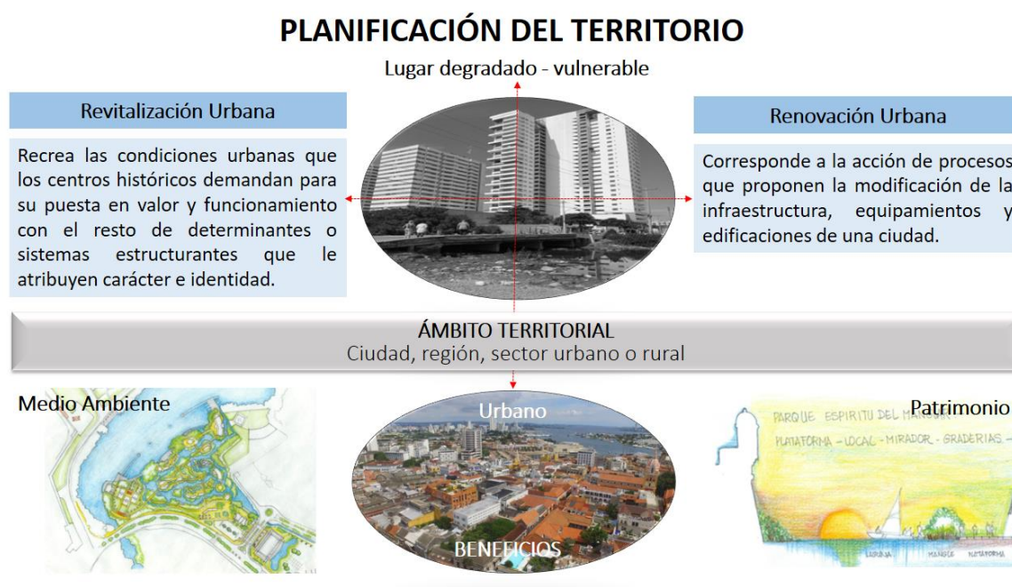
Fig. 2. Planteamiento conceptual de la planificación de un territorio degradado o vulnerable o en potencial desarrollo desde la revitalización y/o renovación urbana.

Renovación Urbana: corresponde a la acción de procesos que proponen la modificación de la infraestructura, equipamientos y edificaciones de una ciudad.