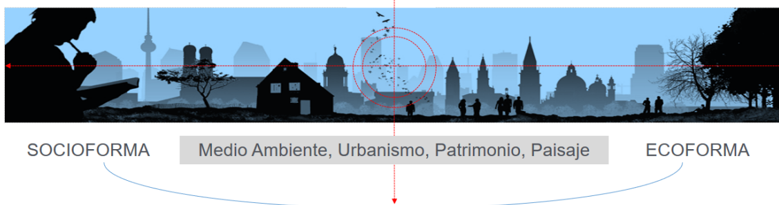
Fig. 1. Planteamiento conceptual del manejo y afectaciones del medio ambiente con el medio antropizado y el patrimonio construido, centrando las acciones de revitalización y/o renovación a través de la ambitectura.

“Ambitectura es la destreza para dar forma concreta al territorio urbano y rural, extensivo e intensivo, natural o muy antropizado. Es construir ese territorio y equiparlo para que sea bello y estimulante, funcional y formativo (como un lenguaje, como una gran obra de arte). Ambitectura es el arte de construir el ambiente, en todas sus escalas y componentes”. (PESCI, Rubén (2007). Ambitectura, hacia un tratado de arquitectura, ciudad y ambiente. Editorial CEPA, Ediciones Al Margen, La Plata, Argentina, pág. 16.