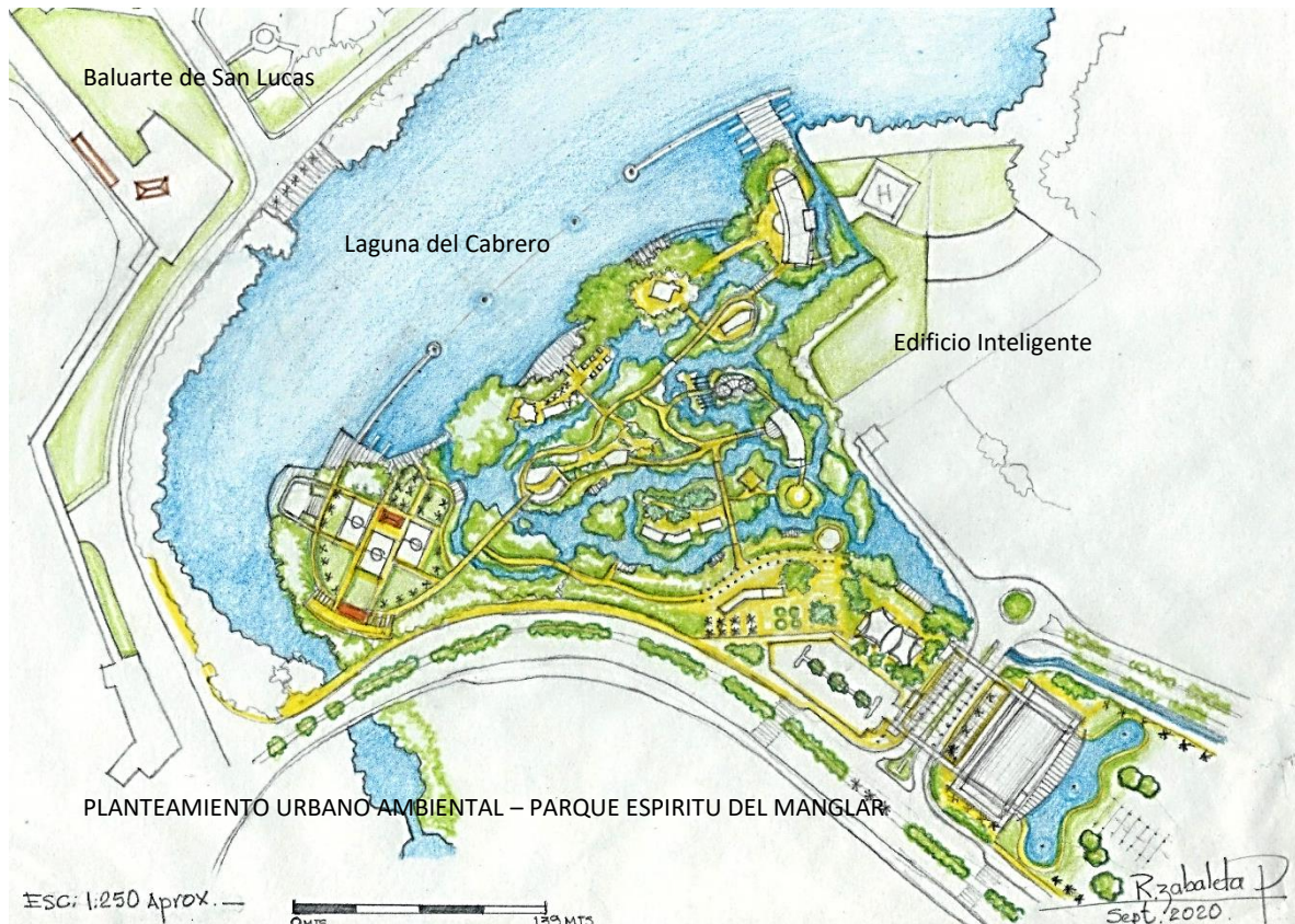
Fig. 3. Plano de Propuesta integral de revitalización y renovación urbana del Proyecto Parque Espíritu del Manglar, antiguo Chambacú en Cartagena de Indias.

Como una respuesta a la problemática urbana de la ciudad del siglo XXI frente al deterioro a que se ven sometidos sectores urbanos o patrimoniales; la revitalización y la renovación urbana surgen como los instrumentos jurídicos y técnicos que buscan mejorarlos integralmente.